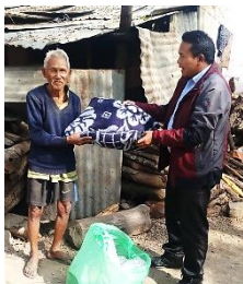
Uitdelen van dekens,