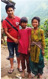
Links Ps. Abisek