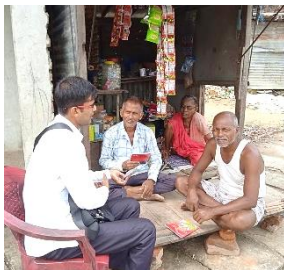
Evangeliseren en uitdelen van folders