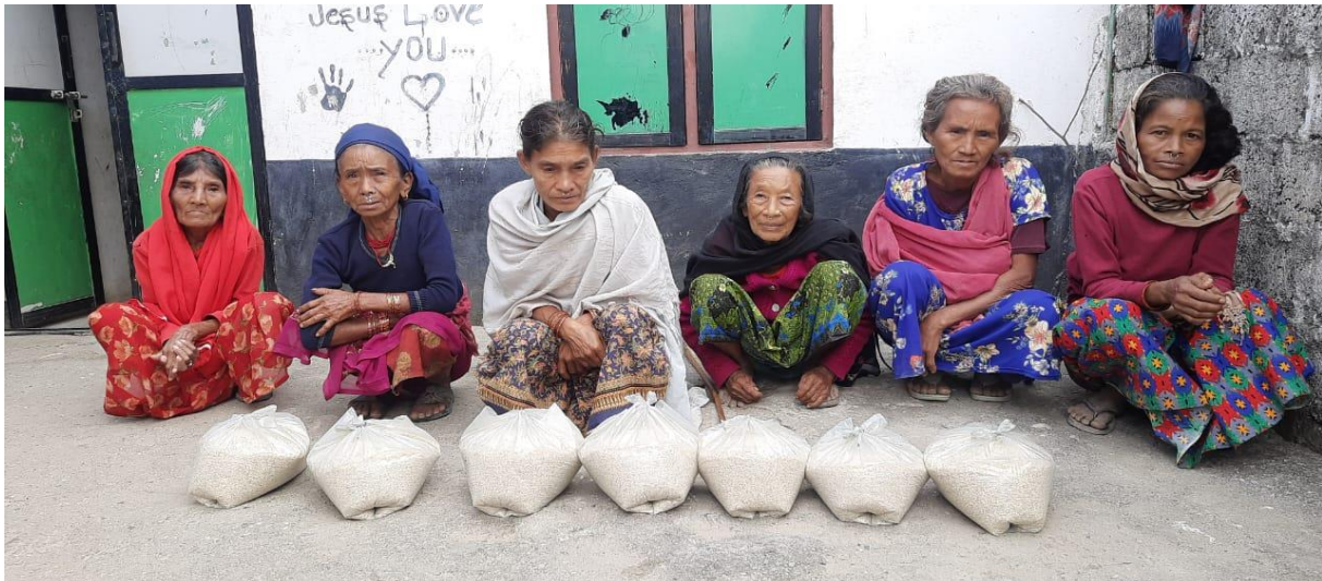
Het verstrekken van rijst aan de weduwen van Ps. Mithun

Allereerst willen wij God prijzen en onze dank uitspreken aan al onze donateurs en sponsors die onze stichting als een schip door moeilijke wateren als corona en inflatie hebben door laten varen. We zijn blij dat onze voorgangers, maatschappelijk werkers en vrijwilligers nooit enige vorm van tekorten hebben ervaren bij het promoten van het Koninkrijk van God. Dit alles is een zegen op ons werk.