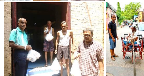
Pakketjes werden zowel aan de oudere mannen als op straat uitgedeeld

Weduwen rijstproject , In 2019 zijn we gestart met het weduwen rijst project. Een project welke wij als bestuur een warm hart toe draagt. We zijn in India gestart met tien weduwwrouwen. Ook in de stad Kolkata is het aantal vrouwen dat rijst krijgt gegroeid. Het afgelopen jaar hebben we 22 vrouwen mogen voorzien van rijst. Samen met Nepal zijn dit 85 personen. Hier onder de foto's van de vrouwen.