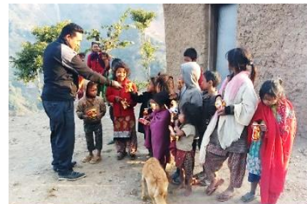
uitdelen van snacks aan de kinderen