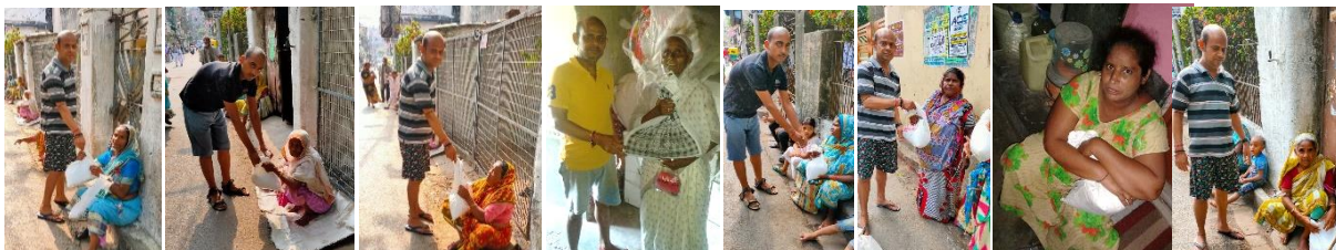
18 weduwwrouwen worden voorzien van rijst