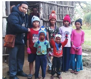
Warme muts en handschoenen