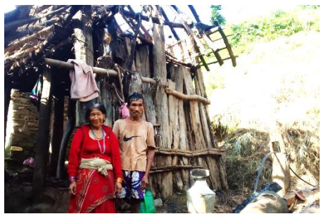
Echtpaar voor hun verbrande huis