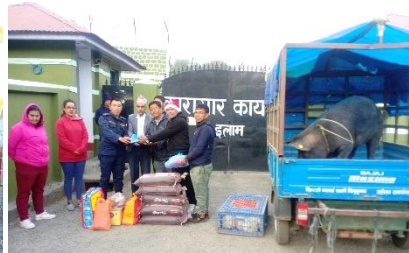
Bezorgen van het kerstmaal van de gedetineerden