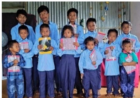
Kopieboeken voor de schoolkinderen