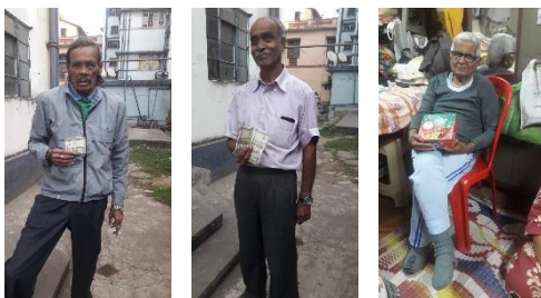
De drie mannen met hun kerst attentie

Hiernaast. De eerste twee mannen wonen in het bejaardentehuis en hebben weinig te besteden ze kregen met kerst een financiële bijdrage. De laatste foto een 91-jarige man, welke nog thuis woont kreeg een kerstcake cadeau.