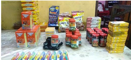
De items die gegeven zijn: Pickles, jam, boter, Glucon D, biscuit, cake, zeep, scheermesjes en tandenborstel

Door Gods zegen groeit ons project in India, vooral in de stad Kolkata. We hebben vrijwilligers die ons komen helpen in ons werk en sommigen dragen bij aan de rijstdistributie en andere essentiële items voor de oude bejaarde mannen, blinden, weduwen en de mensen van de straat zoals u kunt zien op de foto's.