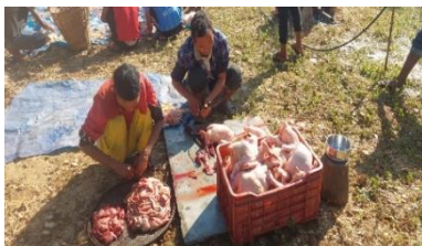
Kippen worden geslacht