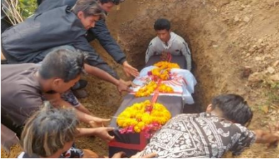
Begravenis in Nepal