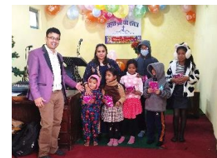
Kerstfeest met de kinderen

Ps. Basudev , krijgt ondersteuning in zijn werk als voorganger. Een echtpaar waarvan de man dialyseert en zijn vrouw hartpatiënt is, krijgen maandelijks een bijdrage om eten te kopen. De vrouw ligt op dit moment in het ziekenhuis i.v.m. hartklachten verder krijgen twee weduwwrouwen iedere maand 5 kg. rijst.