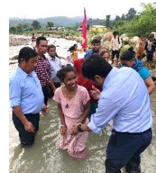
Dopen in een meertje