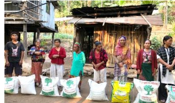
Verstrekken van rijst