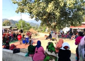
Evangelisatie in de buitenlucht